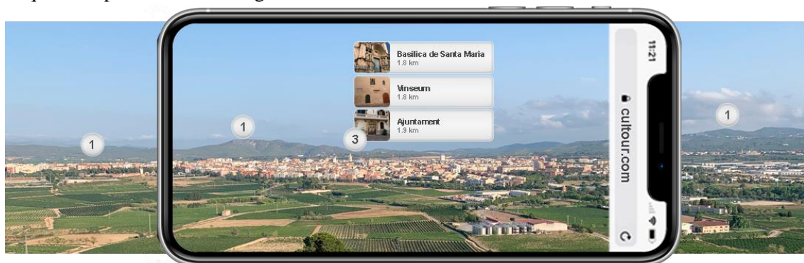
Figura 3. Exemple experiència RA Miravinya Sant Pau.