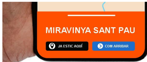
Figura 4. Botons "ja soc aquí" i "com arribar".

Un altre cas d'ús de Cultour es troba en les persones que desconeixen inicialment l'experiència. Aquestes arriben directament al lloc d'interès i mitjançant codis QR poden accedir a la pàgina web de Cultour. D'aquesta manera, l'usuari pot gaudir en el moment de l'experiència de RA, tal i com s'ha explicat anteriorment. Aquest cas d'ús aporta diferents opcions a l'usuari per visitar més llocs emblemàtics del municipi.