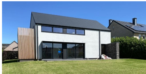
Inici de la construcció i resultat final d'una casa fabricada per l'empresa belga Gablok

D'altra banda, aquest projecte fomentaria una major educació ambiental i conscienciació de l'impacte que tenen els nostres residus, la importància del reciclatge i la reutilització de materials, així com una transformació del teixit productiu local. Aquí seria vital implicar a les plantes processadores de residus (públiques i privades) per tal que formessin part de la cadena de subministrament. A més a més, seguint la línia del Servei d'Educació Ambiental de la Mancomunitat Penedès-Garraf, s'implementarien activitats i serveis en centres educatius i empreses del territori.